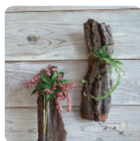
木の一輪挿しに 草花を生けよう (フラワーセラピー体験)