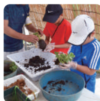
こけ玉作り・ 木への漢字パズル