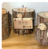
「アサヒの森」の ヒノキ間伐材を使って 「植木鉢」を作る体験