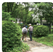
森の恵みクラフト& 木のふしぎ探検